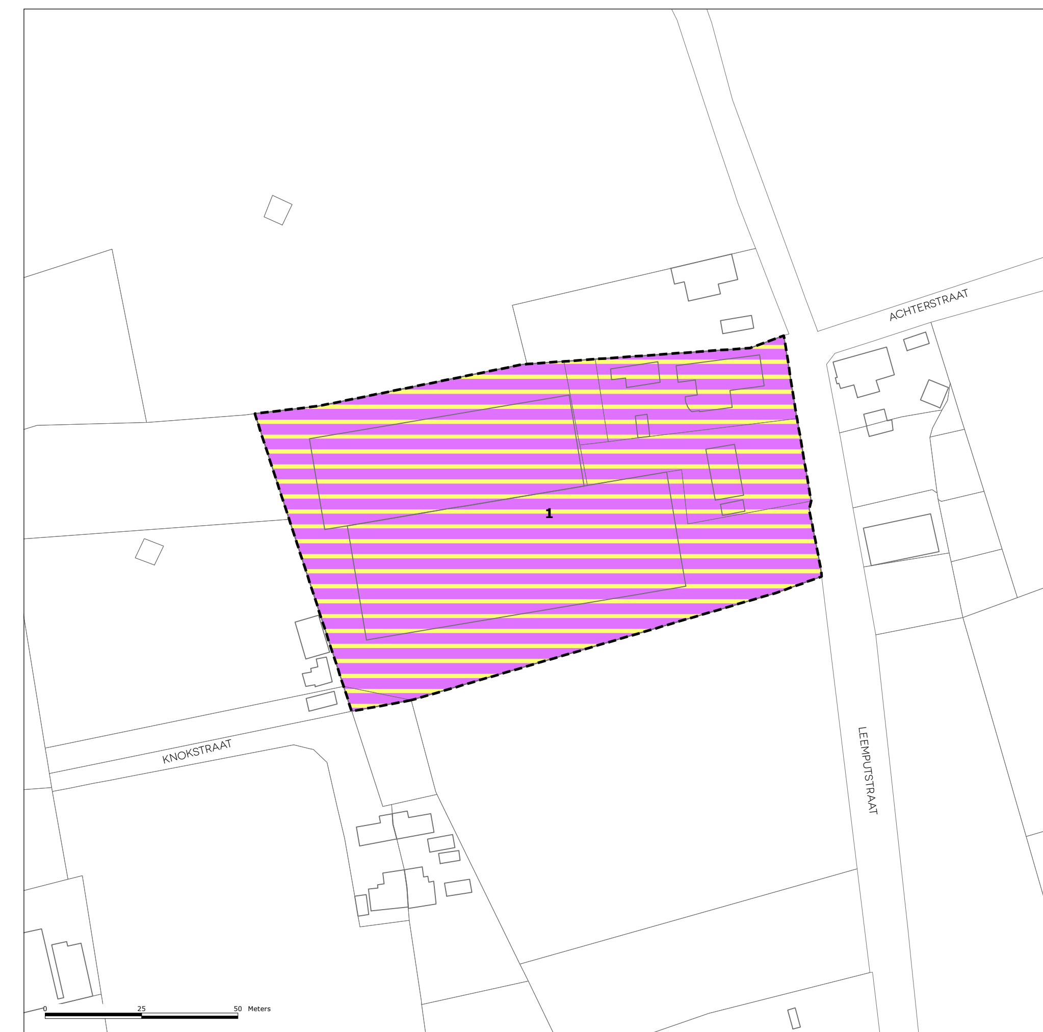
3/ SITE MGC