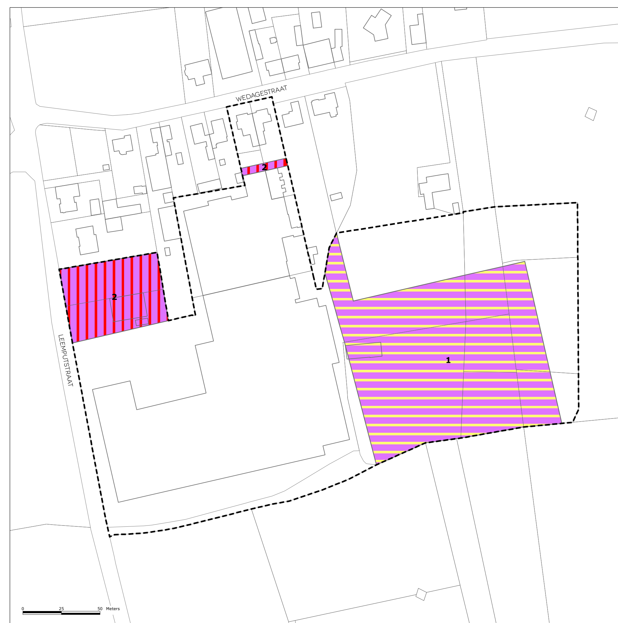
2/ SITE MATTHYS